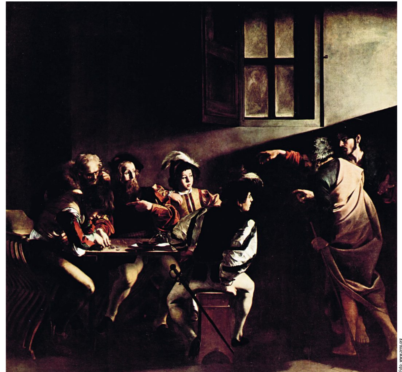
Die Berufung des heiligen Matthäus, 1599–1600. Öl auf Leinwand, 322 x 340 cm. Rom, Contarelli-Kapelle in San Luigi dei Francesi.

strahl auf die Wand kommt gleichsam mit Jesus in den Bildraum und trifft Levi, während alle anderen Personen von anderen Lichtquellen beleuchtet werden! Mit Jesus kommt Licht ins Dunkel.